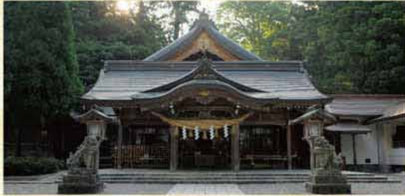
※掲載の写真はイメージです。実際とは異なる場合があります。

日本三名山(富士山・立山・白山)の一つに数えられる白山は、くさむすびを神体山とする白山比咩神社は、全国に約3千社ある白山神社の総本宮で、地元では「しらやまさん」と呼ばれ親しまれています。