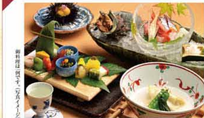
御料理は例です(写真イメージ)

お食事は、加賀の豊かな食材にこだわった 体にやさしいお料理です。 天然もののお造りをはじめ、 加賀の山海の恵みが、 季節の味わいを楽しませてくれます。