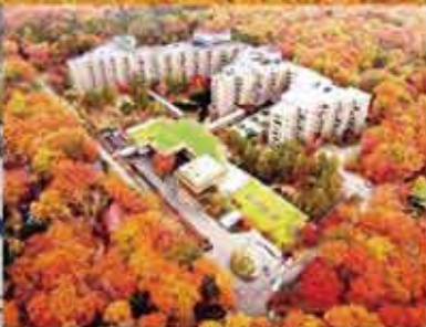
ホテル軽井沢1130(イルブスリゾート)