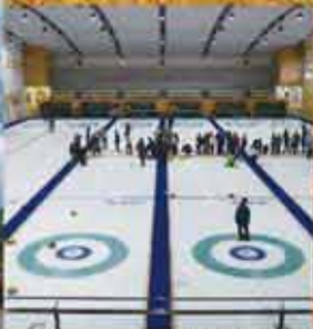
軽井沢アイスパーク