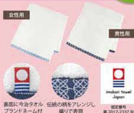
裏面に今治タオル 伝統の柄をアレンジし ブランドネーム付 織りで表現 認定番号 第 2017-2337 号

お誕生日の前に郵便局からお届けします。届かない場合は、 お取引店舗もしくは、業務部にご連絡をお願いします。