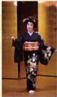
芸妓による山中座四季の舞