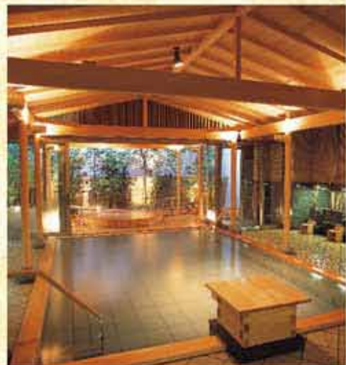
天然檜造りの露天風呂・大浴場「九葉坊の湯」