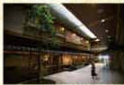
「錦大路」で、お楽しみ路店巡り。