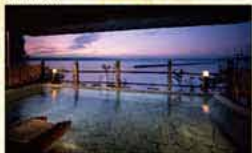
露天風呂から広がる七尾湾の絶景。