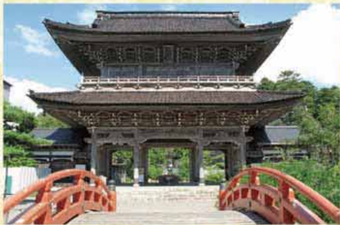
山門(登録有形文化財)

「金箔のかかやきソフトクリーム」は、くいちカフェ(箔巧館内)で味わえます。価格は891円(はくいち)。