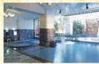
石造りの大浴場「お葉時」の湯