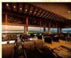
ロビーラウンジ「飛天」