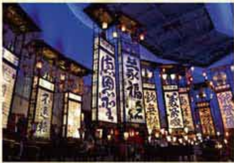
※掲載の写真はイメージです。実際とは異なる場合があります。

祭りの因、能登を代表するキリコ祭りを紹介する施設。館内には、約30基のキリコ(御神燈)が展示され、祭りばやしとともに、華麗でエネルギー溢れる祭りの雰囲気を楽しめます。