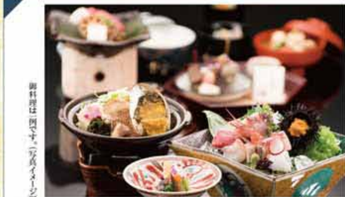
御料理は例です(写真イメージ)

加賀屋の料理長が腕をふるう 会席料理をご用意しております。 豊かな能登の海の魚介、 風味豊かな 能登野菜・加賀野菜を活かした伝統の味。