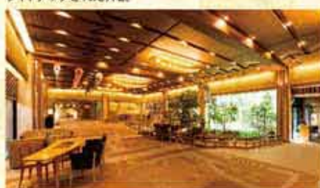
天然木や和紙などをあしらったロビー