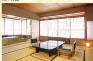
最高級の空間でゆったりとお寛ぎください。 ※お部屋の写真は一例です。