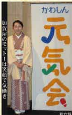
加賀屋のモットーは笑顔で気働き