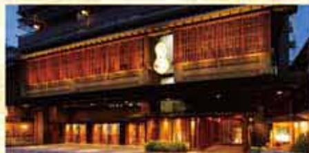
ライトアップされた外観