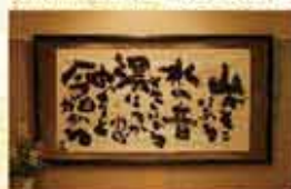
加藤登紀子書 館名や館内の書は