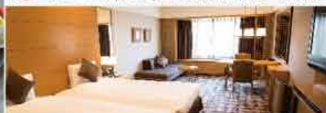
*近畿日本ツーリスト(株)格付けによる。