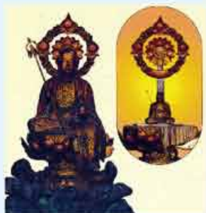
延命地藏願王菩薩と胎内仏

岐阜県下呂市の金錫山地蔵寺。約一千年前の昔、山形県の「出羽三山」の一つである霊山の湯殿山を大本山とする末寺として建立され、当時は湯殿山といわれました。その後、室町時代の飛騨の領主が改め寺を建立し、「金錫山地蔵寺」と称しました。今日でいう「ガン」と思われる難病の人がこの寺で祈禱をすると、「難病から逃れることができた」と言い伝えられています。御本尊の「延命地藏願王菩薩」の中には、純金の杖(錫杖)を持つ胎内仏が納められ、特に内臓の病気を治すと信仰を集めています。