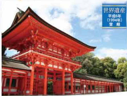
世界遺産 平成6年 (1994年) 登録

二条城 徳川家康が、京都の守護と上洛時の居城として造営し、將軍就任の祝賀式を行いました。幕末の徳川慶喜による大政奉還も、ここで行われました。