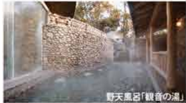
野天風呂「観音の湯」

しもどめ 檜にこだわった「下留の湯」、飛騨の山々を展望できる「展望大浴場」、 樹木と巨岩に囲まれ、野趣あふれる「野天風呂」。館内での湯めぐりもお楽しみいただけます。