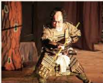
ご見学当日は、歌舞伎姿の役者さんが皆さまの前に登場します。(写真はイメージです。)