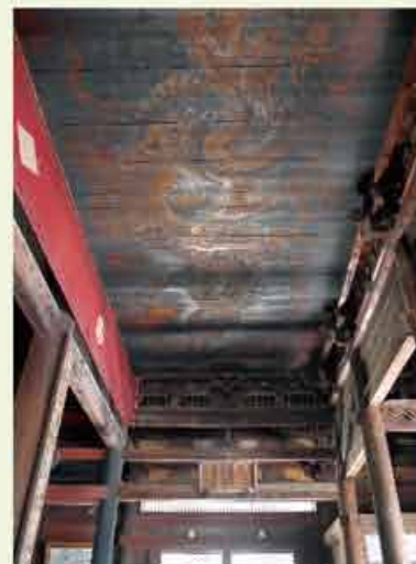
日本一の規模をもつ「鳴き龍」