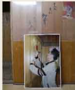
「十八代目 中村勘三郎」の直筆サイン