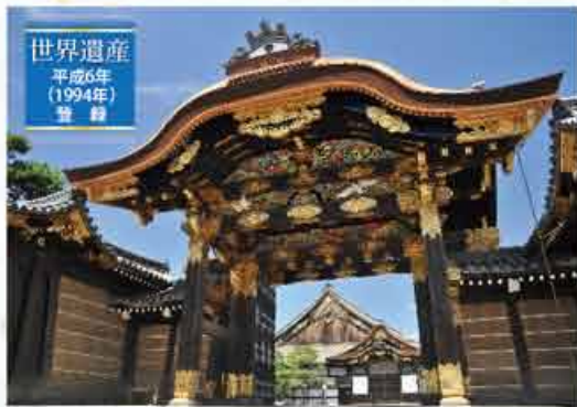
二の丸御殿唐門 大広間

◆ 旅行期間 / 平成30年3月1日(木)〜3月23日(金)の間の2泊3日 ◆ 募集人数 / 400名(各班40名) 最少催行人員各班30名 ◆ 申し込み受付 / 平成29年12月1日(金)から12月15日(金)まで 近畿日本ツーリスト 神戸上丸ビルサービスセンター 東日本「かわしん元気会」旅行デスク ☎ 0570-064-203 受付時間 月～金 10:00～17:00(土日・祝日休) ※休業日と受付時間外の取消変更のお申出には対応できませんので、要営業日の受付となります。 ◆ お問い合わせ / 右記お電話までお気軽にお問い合わせください。