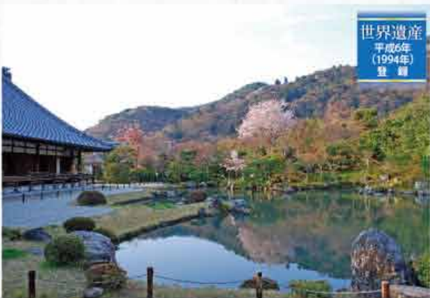
世界遺産 平成6年 (1994年) 登録