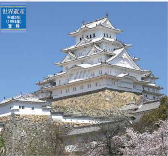
世界遺産 平成5年 (1993年) 登録

名勝の地・嵐山の象徴ともいえる渡月橋。亀山上皇が橋を渡るように動く月を眺め、「くまなき月の渡るに似ると言ったことから、この名がつけられました。